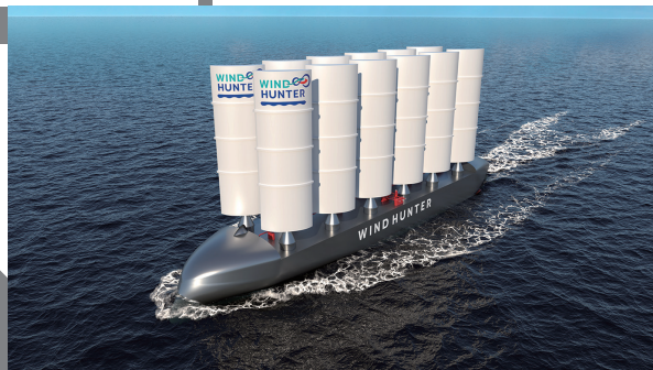
帆船を発展させた構想中の水素エネルギープラント