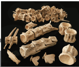
縄文遺跡から発掘された大量のマグロ骨 所蔵:気仙沼市教育委員会