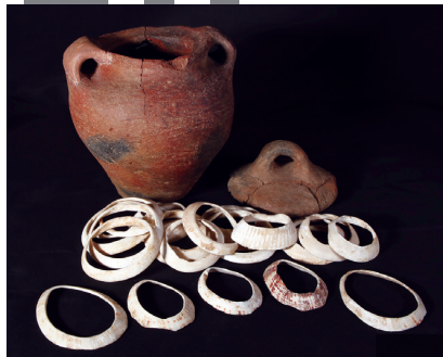
縄文人が遠い島から入手していた貝のアクセサリー 所蔵:東京大学総合研究博物館