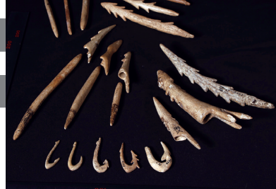
縄文人が使っていた精巧な漁具 所蔵:東京大学総合研究博物館