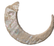
沖縄島で発掘された世界最古の釣り針 所蔵:沖縄県立博物館・美術館