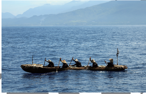
台湾から与那国島を目指す丸木舟 国立科学博物館「3万年前の航海 徹底再現プロジェクト」より