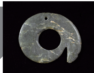
縄文人が八丈島へ持ち込んだ石製アクセサリー 所蔵:八丈町教育委員会