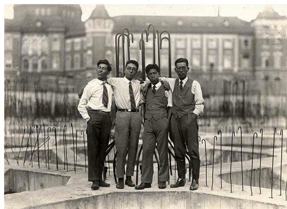
工事に携わった技師たち 1929(昭和4)年頃か