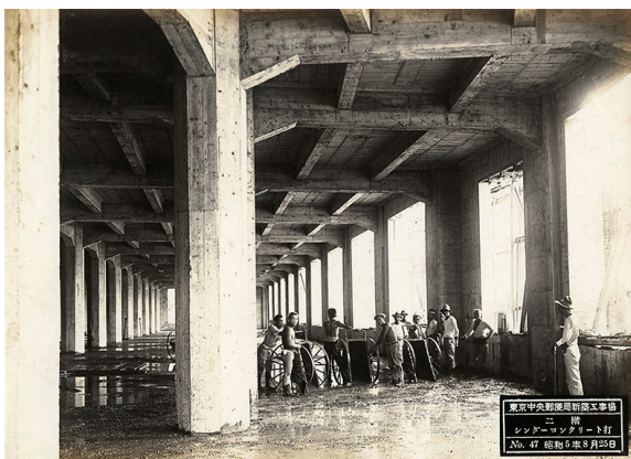
東京中央郵便局新築工事場「二階シンダーコンクリート打」No.47 1930(昭和5)年8月25日